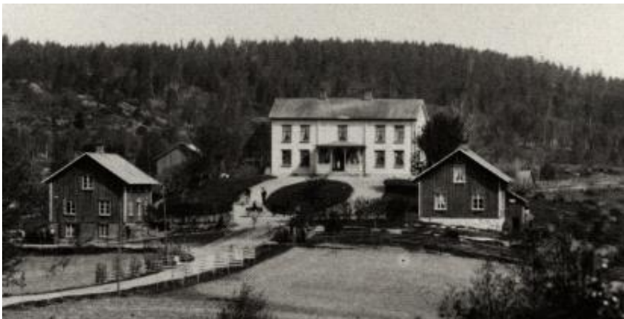
Herrgården i Åsebyn.

Åsebyn 1:49, Herrgården, text enligt boken Sveriges bebyggelse, landsbygden 1964.