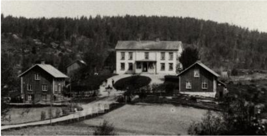
Herrgården i Åsebyn