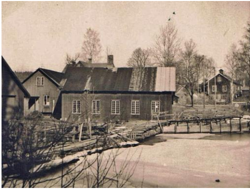
Gamla verkstaden med magasin till vänster och Kvarnen uppe till höger.