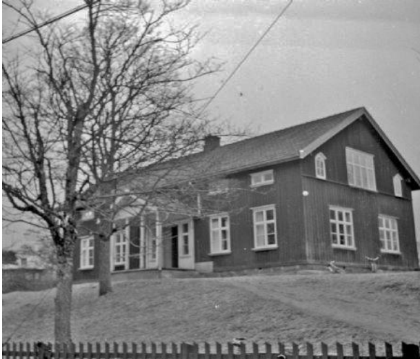
Skolhuset i Åsebyn