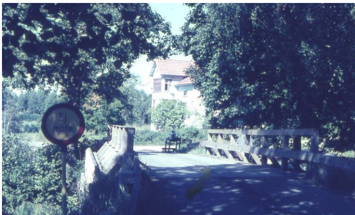
BILD GAMLA BRON OCH SKYLTT EJ MÖTE. Korset i Åsebyn med mjölkpall. Riksväg mellan Karlstad och Oslo fram till år 19???. Skylten EJ MÖTE roade många eftersom Pingsförsamlingens möteslokan, som syns i bakgrunden, låg endast några meter från skylten.